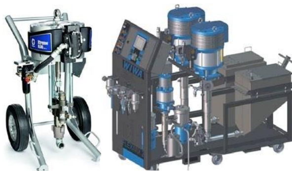
1C безвъздушно оборудване

Безвъздушното пръскане на HENSOTHERM® 910 KS изисква високопроизводителни 1C и 2C пръскачки. Списък с устройства с проточни нагреватели е наличен при поискване. Препоръчват се дюзи за високо налягане (XHD) от 0,019" – 0,025". Ъгъл на пръскане: > 30°